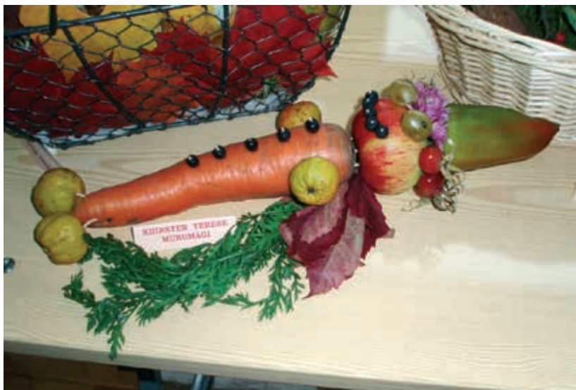
Lamav köögiviljamees (sügise sünnipäev)