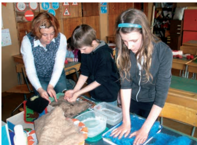
Viltimine ei ole lihtne (kunstinädal).