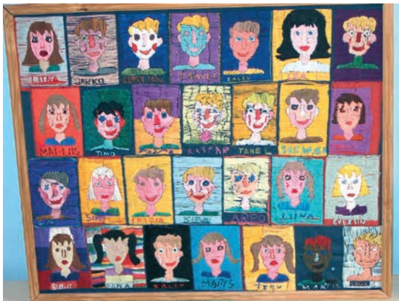
Tikutud klassipilt (kingitus õpetajale)