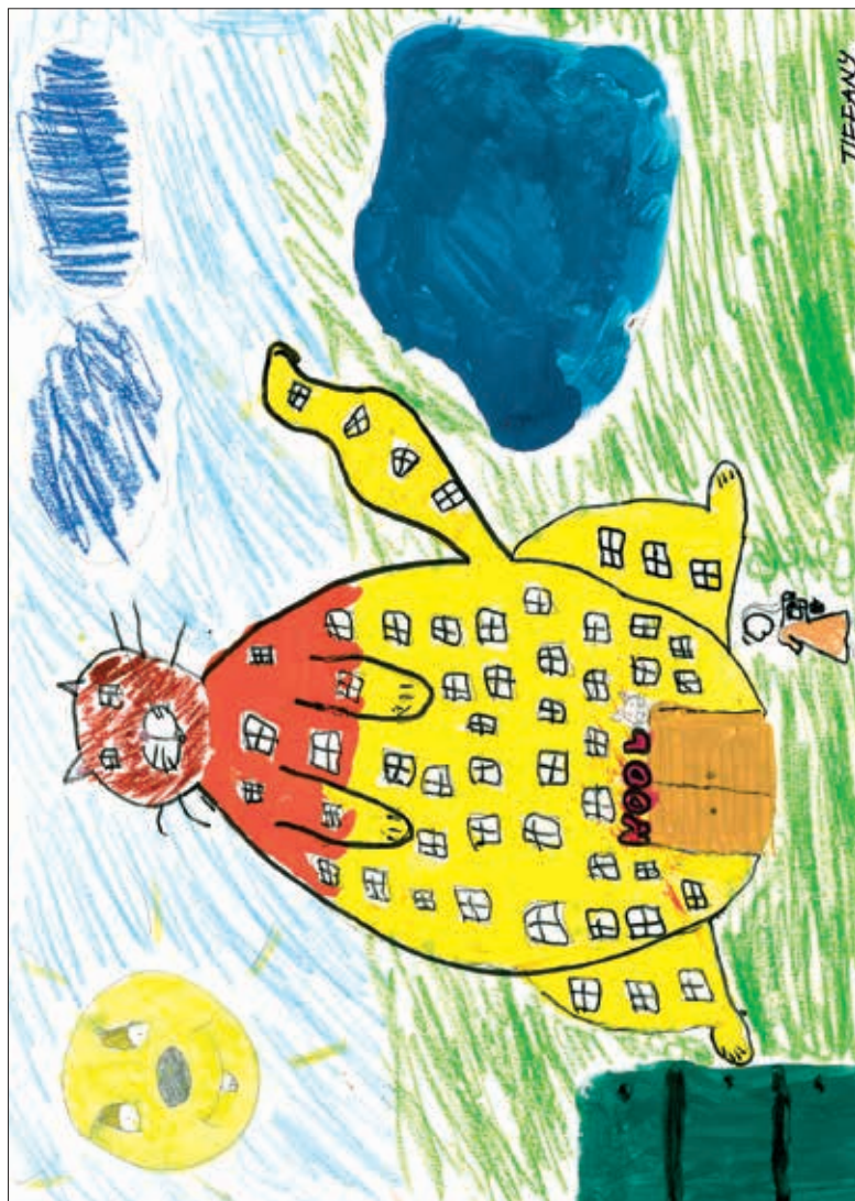
Tiffany Lebedev, 3. a klass „Tulevikukool“