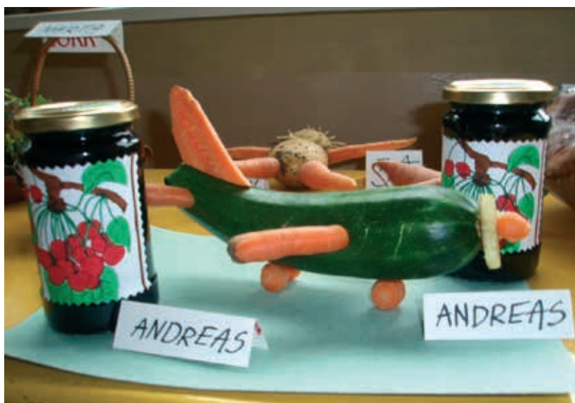
„Lennuväljal“ (sügise sünnipäev)