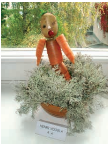
Porgandipoiss (sügise sünnipäev)