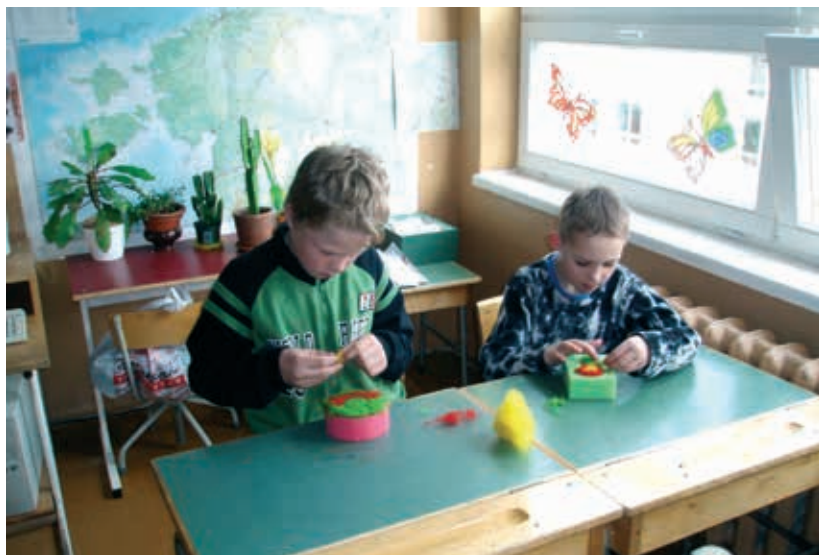
Poisid tööhoos (kunstinädal).