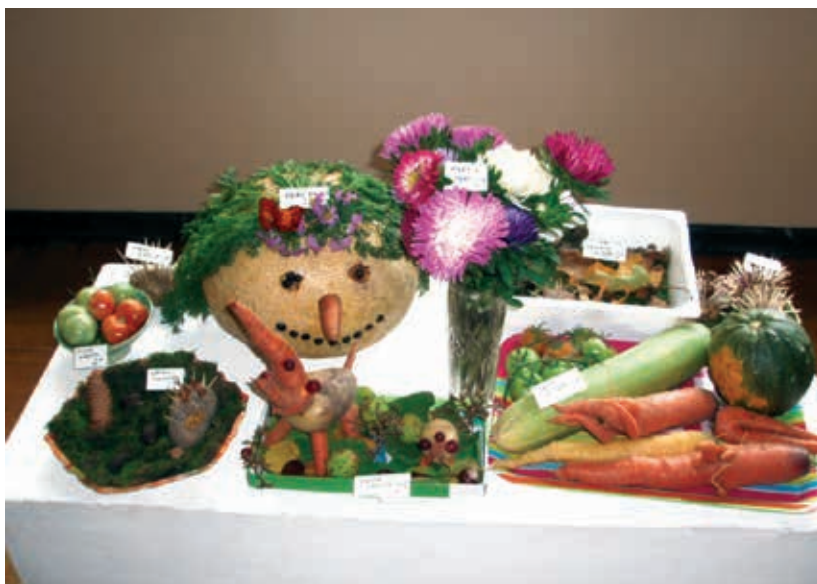
Nunnunäitus (sügise sünnipäev)