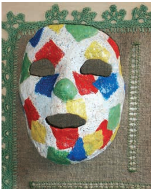
Valmis mask (kunstinädal)