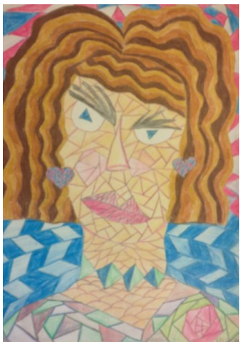
Kelly Arula 8.a klass