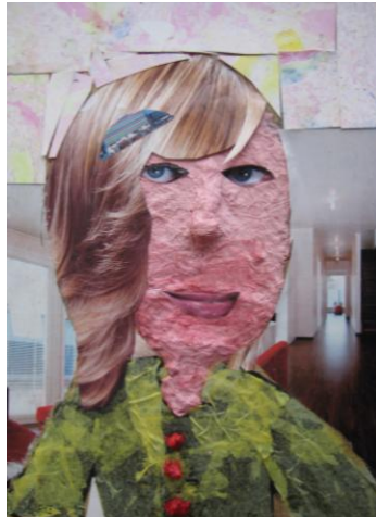
Kirke Klmhallik 3.a klass