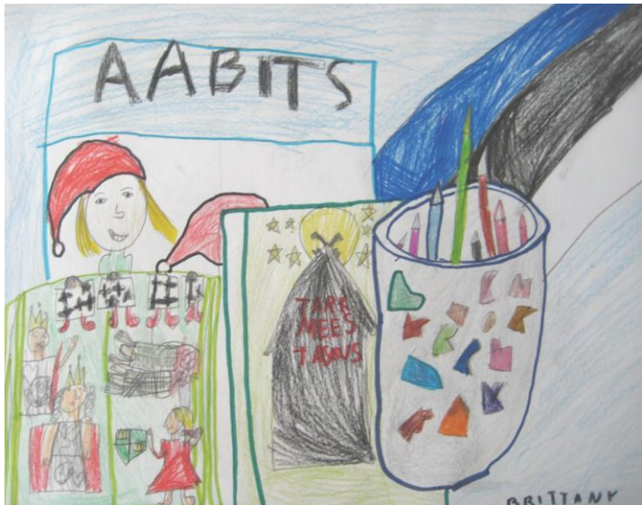
Brittany Korkma 1.b klass