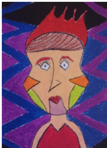
Ann Münter 8.a klass