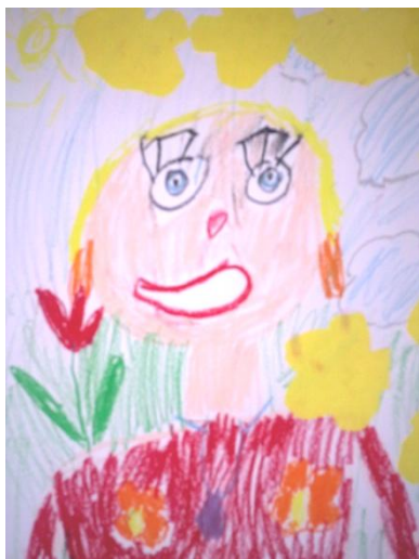
Karmen Tamm 1.a klass