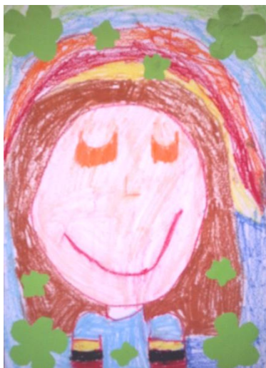
Kristi Viita 1.a klass