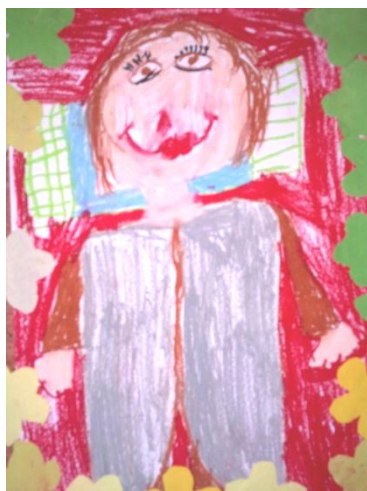
Anette Traus 1.a klass