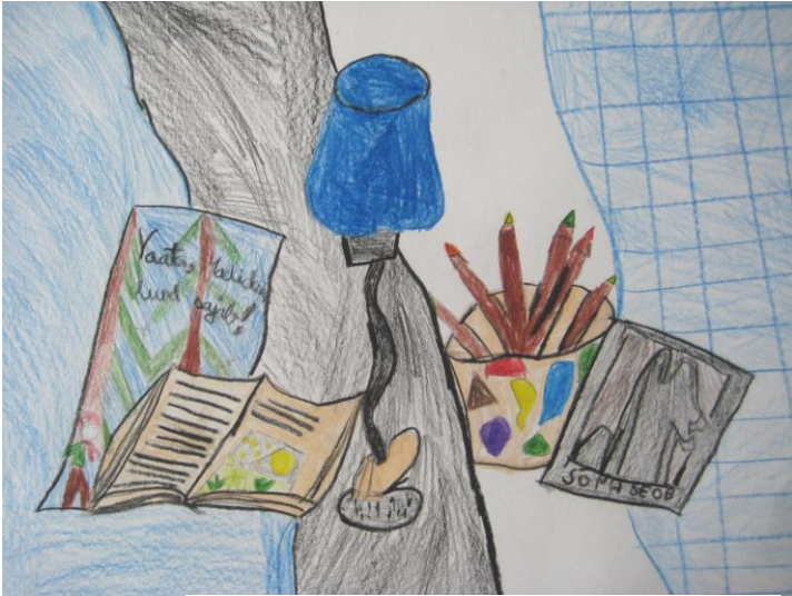
Mirell Viru 3.a klass